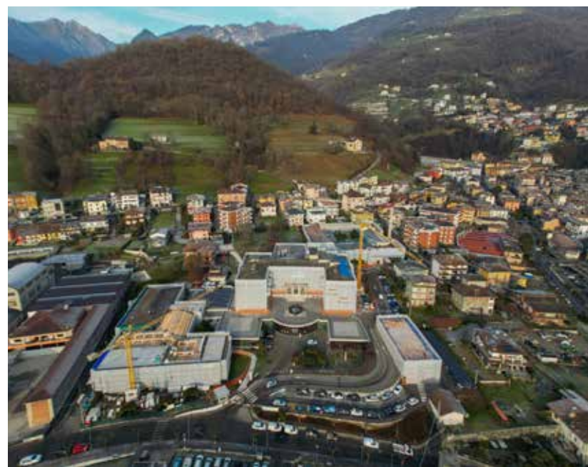
L'AREA RIQUALIFICATA A VERTOVA SI ESTENDE SU UNA SUPERFICIE DI OLTRE 13.000 METRI QUADRI