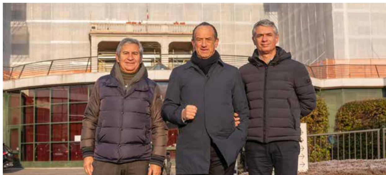
I DIRIGENTI DELLA BANCA BPM CON IL TITOLARE DELLA REVO COSTRUZIONI

In qualità di General Contractor, i lavori da effettuare sono stati pertanto affidati alla Revo Costruzioni, azienda leader del settore, realtà specializzata nell'affrontare le sfide del presente e del futuro nel campo della costruzione, manutenzione e riqualificazione degli edifici, che si è dunque posta l'obiettivo di ristrutturare e riqualificare quest'ampia area nel comune di Vertova. La Fondazione Gusmini (che ha beneficiato di 15 milioni con il Superbonus governativo per le Onlus), grazie all'intervento di Revo Costruzioni, potrà dunque eseguire importanti interventi di manutenzione straordinaria su tutti e quattro gli edifici della struttura, che si focalizzeranno sull'efficientamento energetico e il miglioramento sismico delle strutture portanti,