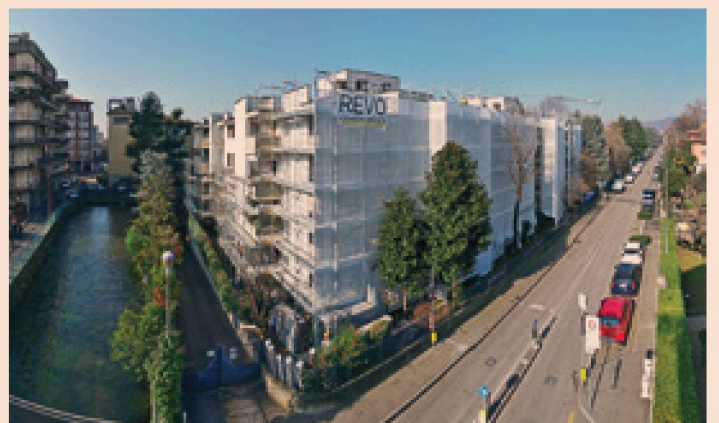
CANAPIFICIO - BERGAMO