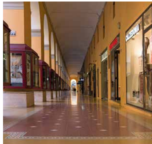
LA RIQUALIFICAZIONE DEI PORTICI DI IMPERIA