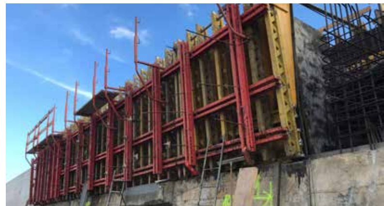
IL RINFORZO DELLA DIGA FORANEA A PORTOSOLE, SANREMO

L'azienda opera su tutto il territorio nazionale, portando i propri servizi a tutti i comuni e le regioni italiane. Oggi Revo Costruzioni è coinvolta nei lavori di ricostruzione nel comune di Macerata, dove questo mese la ditta ha avviato tre cantieri di demolizione e ricostruzione. Un altro pilastro fondamentale dell'attività dell'azienda è la collaborazione con Banca BPM, volta a promuovere la sostenibilità energetica e la sicurezza sismica. Un esempio tangibile di questa partnership è il progetto di riqualificazione e miglioramento sismico di una RSA a Bergamo, del valore di 20 milioni di euro, con un impegno che si protrarrà fino a dicembre 2025. Nel corso degli anni, l'Azienda ha lasciato un segno tangibile anche in Liguria, dove ha