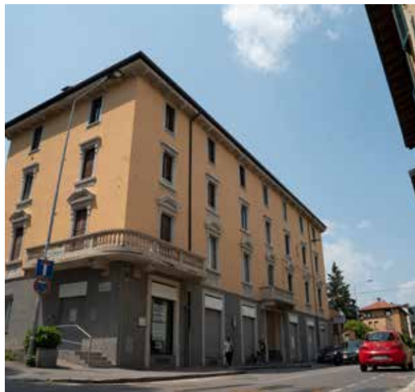
LA RISTRUTTURAZIONE DI UN EDIFICIO RESIDENZIALE A BERGAMO

nire soluzioni su misura e di alta qualità per garantire la sicurezza, la durabilità e la funzionalità degli edifici. È proprio in questo scenario che Revo Costruzioni si distingue come leader indiscusso nel settore delle costruzioni. Con una reputazione consolidata e una vasta esperienza nel campo dell'edilizia, Revo Costruzioni si pone come il partner ideale per affrontare le sfide del presente e del futuro nel campo della costruzione e della manutenzione degli edifici. L'azienda ha sviluppato una struttura tecnico-amministrativa imbattibile, supportata da un team di professionisti altamente qualificati. Revo Costruzioni si impegna a fornire soluzioni globali, prendendo a cuore ogni fase del processo edilizio: dalla pianificazione finanziaria alla ricerca e qualificazione dei