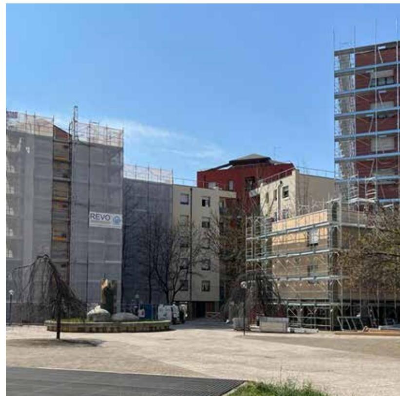
I LAVORI DI REVO COSTRUZIONI NEL QUARTIERE DI BORG PALAZZO A BERGAMO

Tuttavia, l'apporto di Revo Costruzioni alla rinascita della città di Bergamo non si è limitato alla sola riqualificazione abitativa. Anche gli edifici storici, testimoni del passato della città, sono stati oggetto di attenzione. Grazie a interventi mirati, gli uffici risulteranno ai primi del Novecento sono stati resi più sicuri dal punto di vista sismico, preservando così il patrimonio